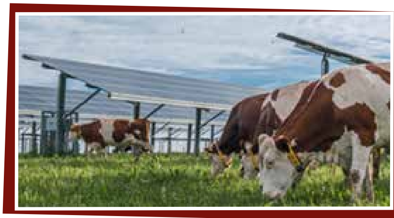
élevage bovin avec trackers solaires

*APIEEE : Association pour la Protection, l'Information et l'Etude de l'Eau et de son Environnement.